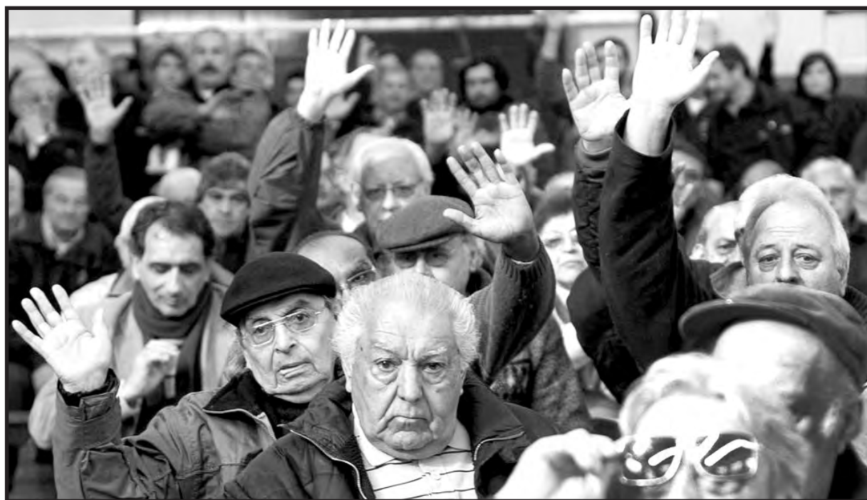
A los jubilados les robarán parte de sus haberes

En síntesis: los actuales jubilados (cuyo 75% cobra la mínima) serán quienes financiarán toda esta negociación entre Macri y los gobernadores. El año próximo cada jubilado perderá un promedio de casi 1.000