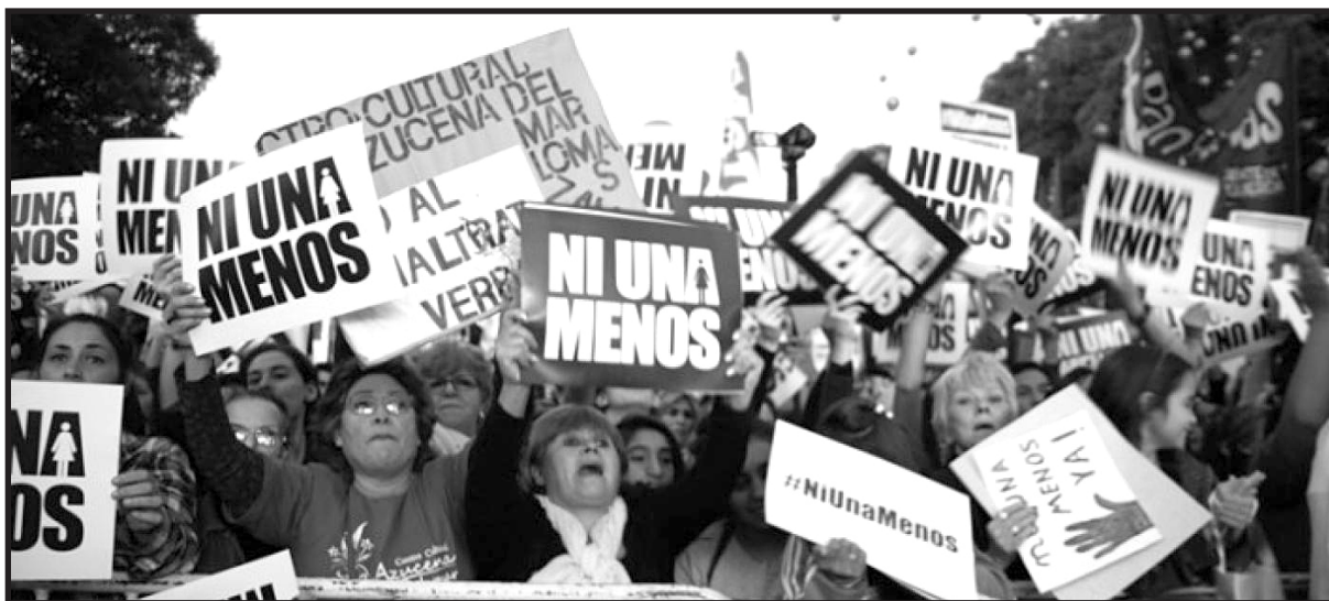
Marcha exigiendo por el #NiUnaMenos: el gobierno es responsable

Patria, Minerva y María Teresa Mirabel eran tres hermanas dominicanas que luchaban contra la dictadura cruenta de Trujillos. El 25 de noviembre de 1960 fueron secuestradas y brutalmente asesinadas por el gobierno. Se ensañaron con ellas especialmente por ser mujeres luchadoras que se rebelaron contra la dictadura y los mandatos para las mujeres. Hoy, casi sesenta años después, el movimiento de mujeres sigue levantando esta fecha como una de las más importantes para reclamar: basta de femicidios, golpes, violaciones, secuestros de las redes de trata, discriminación laboral y abortos clandestinos. Recordamos a las Mariposas con nuestro grito en las calles.