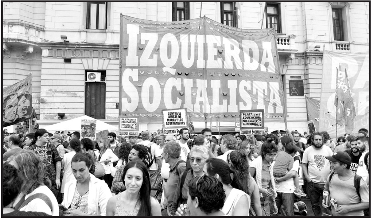
Frente a los partidos patronales, Izquierda Socialista se postula para construir una alternativa política de los trabajadores

Queremos entablar un diálogo fraterno con aquellos compañeros con quienes venimos compartiendo luchas y actividades para plantearles la necesidad de que se incorporen a nuestro partido. Tenemos por delante una tarea histórica.