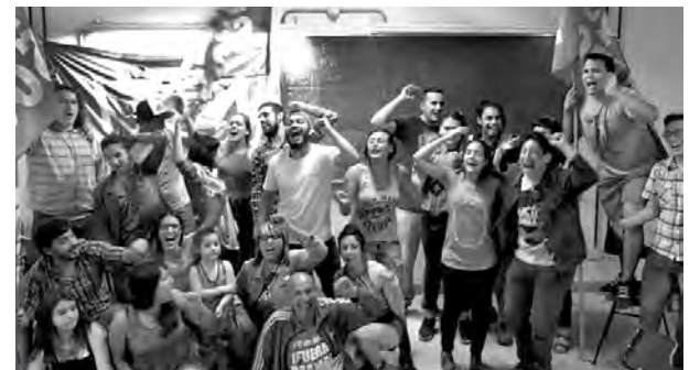
La juventud de Izquierda Socialista festejando el triunfo