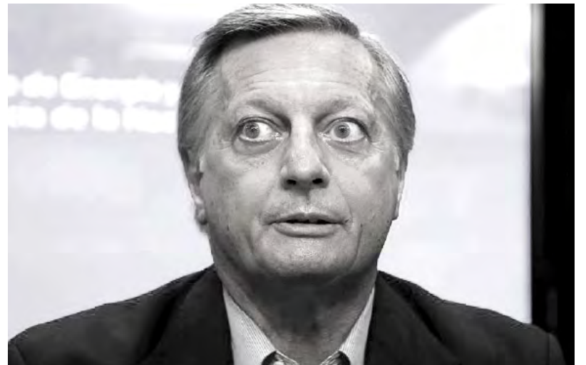
Aranguren sigue garantizando los negocios de Shell y tarifazos al pueblo trabajador

Hoy, con todos los tarifazos a cuestas, los servicios privatizados continúan siendo de mala calidad, Edenor y Edesur son un ejemplo. Desde Izquierda Socialista planteamos que la única salida es reestatizar las empresas privatizadas y ponerlas a funcionar bajo gestión de sus trabajadores y usuarios. Solo así se podrá garantizar que todos tengan acceso a estos servicios esenciales, con tarifas sociales y la calidad adecuada.