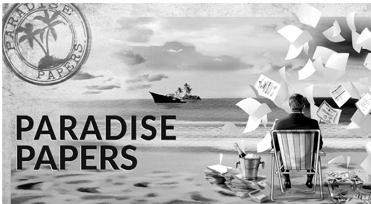
Se destapó un nuevo escándalo de corrupción capitalista con los “papeles del paraíso”

Los Paradise Papers revelan que los dueños de ese dinero “negro” son, entre otros, los ministros de Finanzas