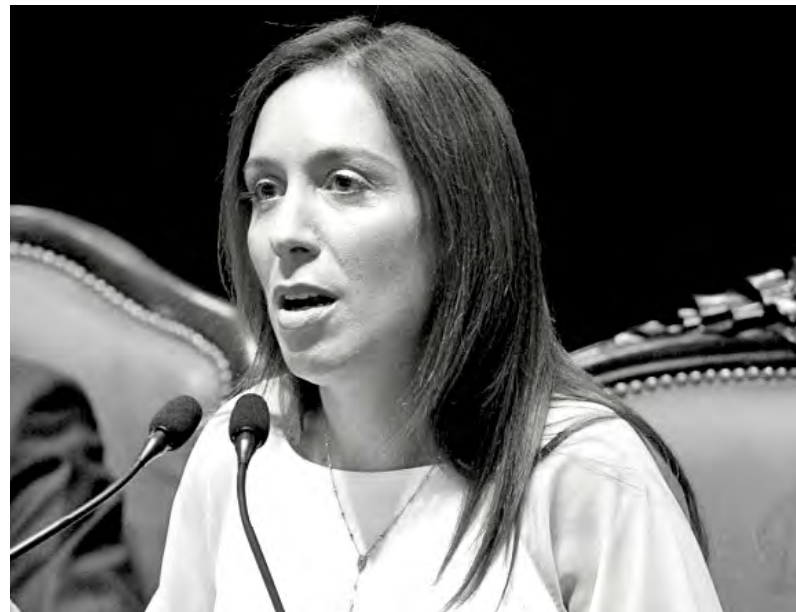
La gobernadora Vidal presentó el presupuesto de 2018 con un ajuste a tono con el nacional

Con este presupuesto tampoco habrá reactivación del sistema fe-