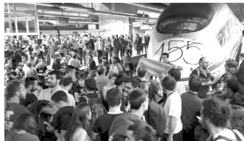
Piquete deteniendo el tren de alta velocidad (AVE) durante la huelga

La dirección del Partido Demócrata Europeo Catalán, independen-